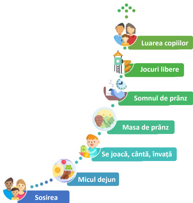
Imaginea 1: Reprezentare simplificată a opțiunilor de îngrijire a copiilor în Germania