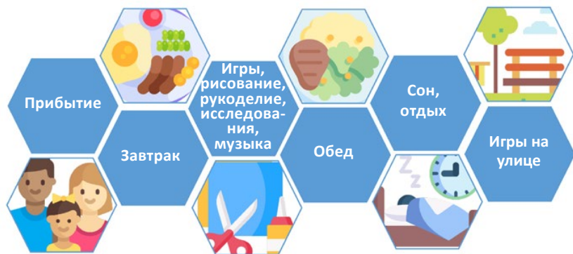
Рисунок 1. Схематичное представление вариантов ухода за детьми в Германии