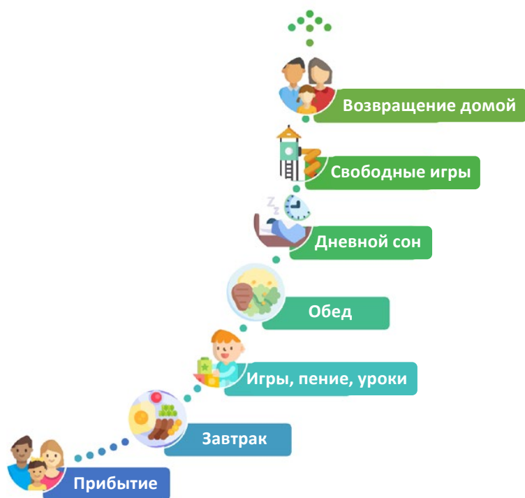
Рисунок 1. Схематичное представление вариантов ухода за детьми в Германии