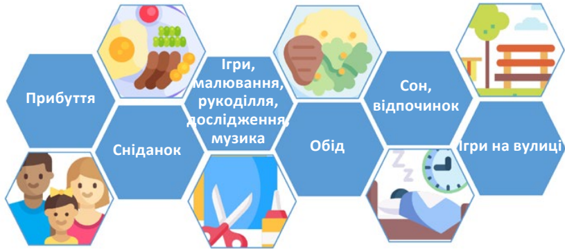
Рис. 1. Спрощена схема варіантів догляду за дітьми в Німеччині