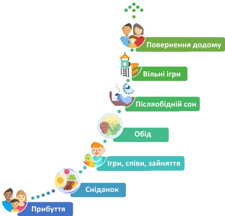
Рис. 1. Спрощена схема варіантів догляду за дітьми в Німеччині