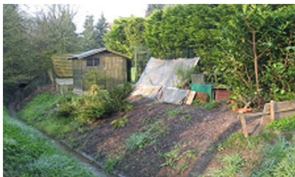
Anlagen im Gewässerrandstreifen