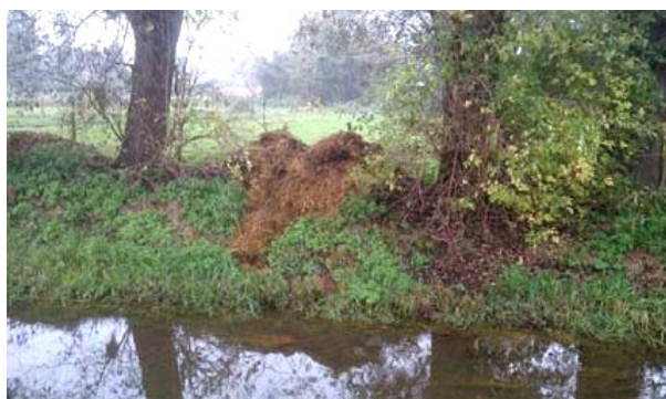
Dunglagerung im Gewässerrandstreifen

Gewässer sind als Bestandteile des Naturhaushalts, als Lebensgrundlage des Menschen, als Lebensraum für Tiere und Pflanzen sowie als nutzbares Gut geschützt. Verschiedene Gesetze sichern den Zustand der Gewässer und sorgen dafür, dass der Eintrag von Schadstoffen vermindert wird. Das Wasserhaushaltsgesetz (WHG) und das Landeswassergesetz (LWG NRW) gelten für Gewässerrandstreifen, die fünf Meter ab Böschungskante betragen.