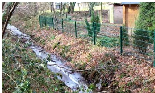
Zaunerrichtung auf Böschungsoberkante