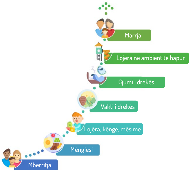
Figura 1: Paraqitje e thjeshtuar e opsioneve të kujdesit për fëmijët në Gjermani