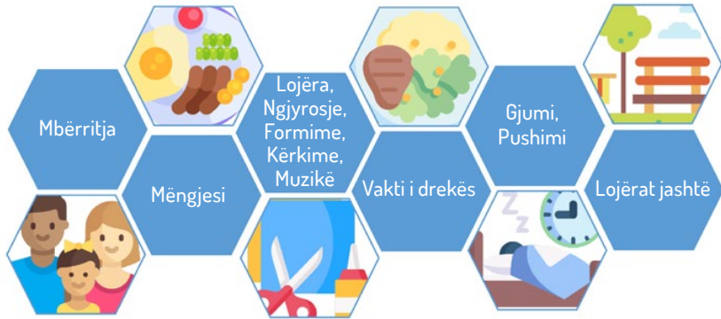
Figura 1: Paraqitje e thjeshtuar e opsioneve të kujdesit për fëmijët në Gjermani