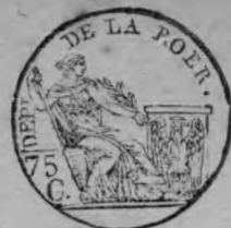
TABLE ALPHABÉTIQUE des Actes de naissances de la mairie de Sickingen — pour l'an 1814 dressé en exécution du décret im- périal du 20 juillet 1807.