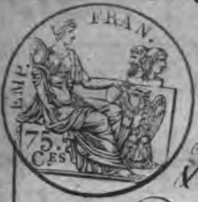
Table Alphabétique des actes des Décès de la Mairie de Vierssen pour l'an douze, dressée en Exécution du Décret impérial du 20 juillet 1807