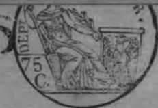
TABLE ALPHABÉTIQUE des Actes de décès de la mairie de Villerben pour l'an 1811 dressée en exécution du décret impérial du 20 juillet 1807.