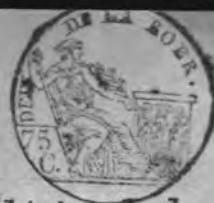
TABLE ALPHABÉTIQUE des Actes de décès de la mairie de Viers pour l'an 1812 dressée en exécution du décret impérial du 20 juillet 1807.