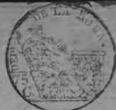
TABLE ALPHABETIQUE des Actes des décès de la mairie de Vierßen pour l'an 1811 dressée en exécution du décret impérial du 20 juillet 1807.