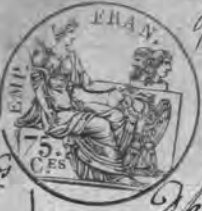
Table alphabétique des Actes des Décs de la Marine Vusien pour l'an Dix dressé en exécution du Décret impérial du 20 Juillet 1807.