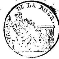
TABLE ALPHABÉTIQUE des Actes des décès de la mairie de Waldenkirchen pour l'an 1811. dressée en exécution du décret impérial du 20 juillet 1807.

Le mois ans, adjoint Ancien de Mathieu 1, demeurant sion du dé de l'ancien en, que les quels mais de dé neuf heures de mari ans, pour de Pierre leur Sybille après qu'il 1, déclaré