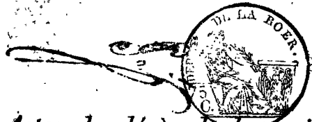
TABLE ALPHABÉTIQUE des Actes de décès de la mairie d'Hallemstuckien pour l'an 1814 dressée en exécution du décret impérial du 20 juillet 1807.