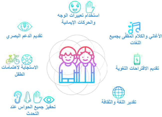
الشكل 2: المبادئ الأساسية للدعم اللغوي